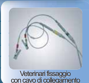
Veterinari fissaggio con cavo di collegamento